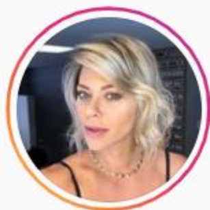
@heloferreiraoficial 2K seguidores