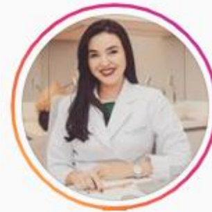
@dradanimenezes 5,6k seguidores