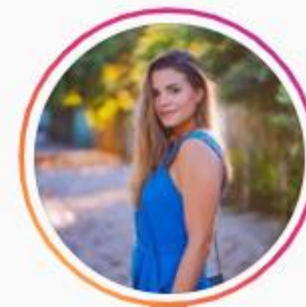
@armariodemadame 82K seguidores