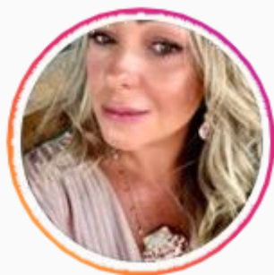
@melinapietro 570 seguidores