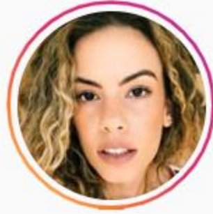
@juliananeimann 2,2k seguidores