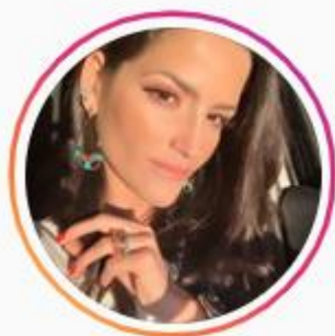
@carolvbrios 2,3K seguidores