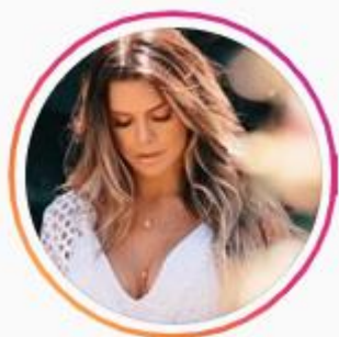
@juliamcsampaio 339K seguidores